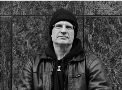
mikebo Photo: Lothar Saßerath

Ainsi, les mélodies et les structures harmoniques n'apparaissent souvent que sous l'inspiration des sons et des effets les plus intéressants. Grâce à cette approche, la plupart de ses morceaux prennent au fur et à mesure le caractère d'une bande-son enlevée, où l'imaginaire apporte les images correspondant au film musical.